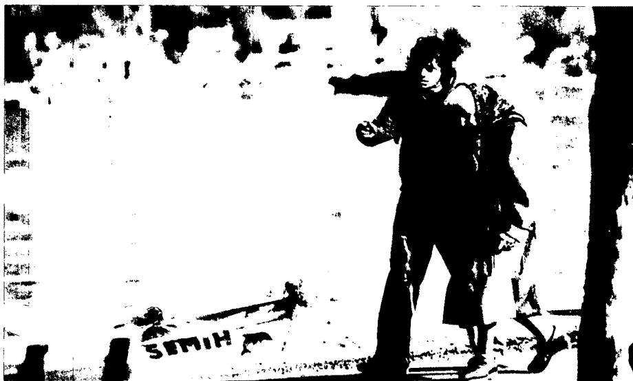
'La Caja de Pandora', de Yesim Ustaoglu, és la preestrena que inaugura la Mostra.