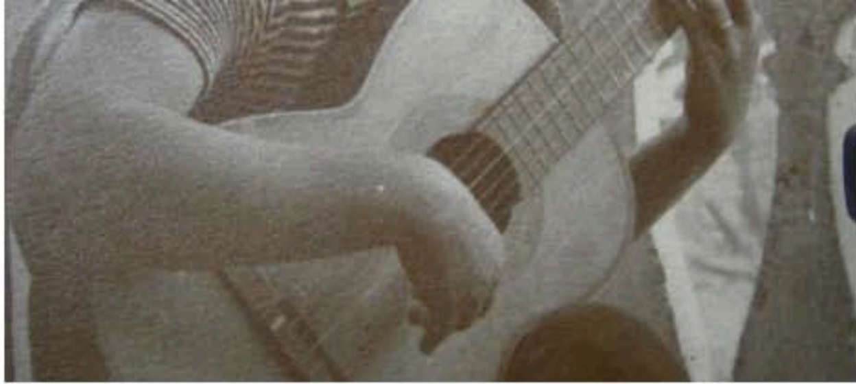
Una de las pocas fotografías que se conservan de Clara Pueyo

La narración se articula a través de una voz en off , ¿por qué decidiste utilizar una locución masculina?