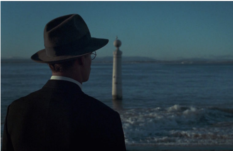
“Como Fernando Pessoa Salvó Portugal” de Eugène Green.