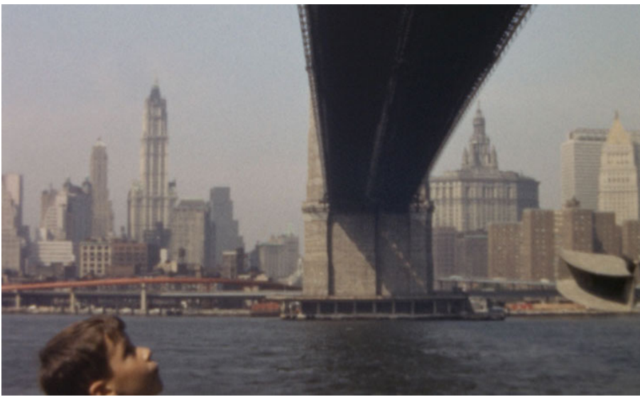
“Un paseo por New York Harbor” de Carolina Astudillo.