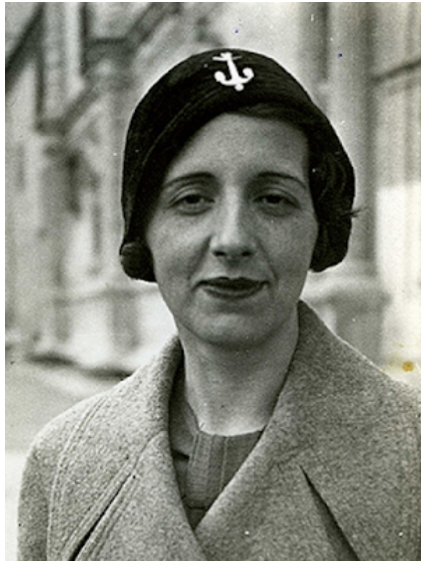
María Zambrano (1904-1991) fue una intelectual, poeta, filósofa y ensayista española.