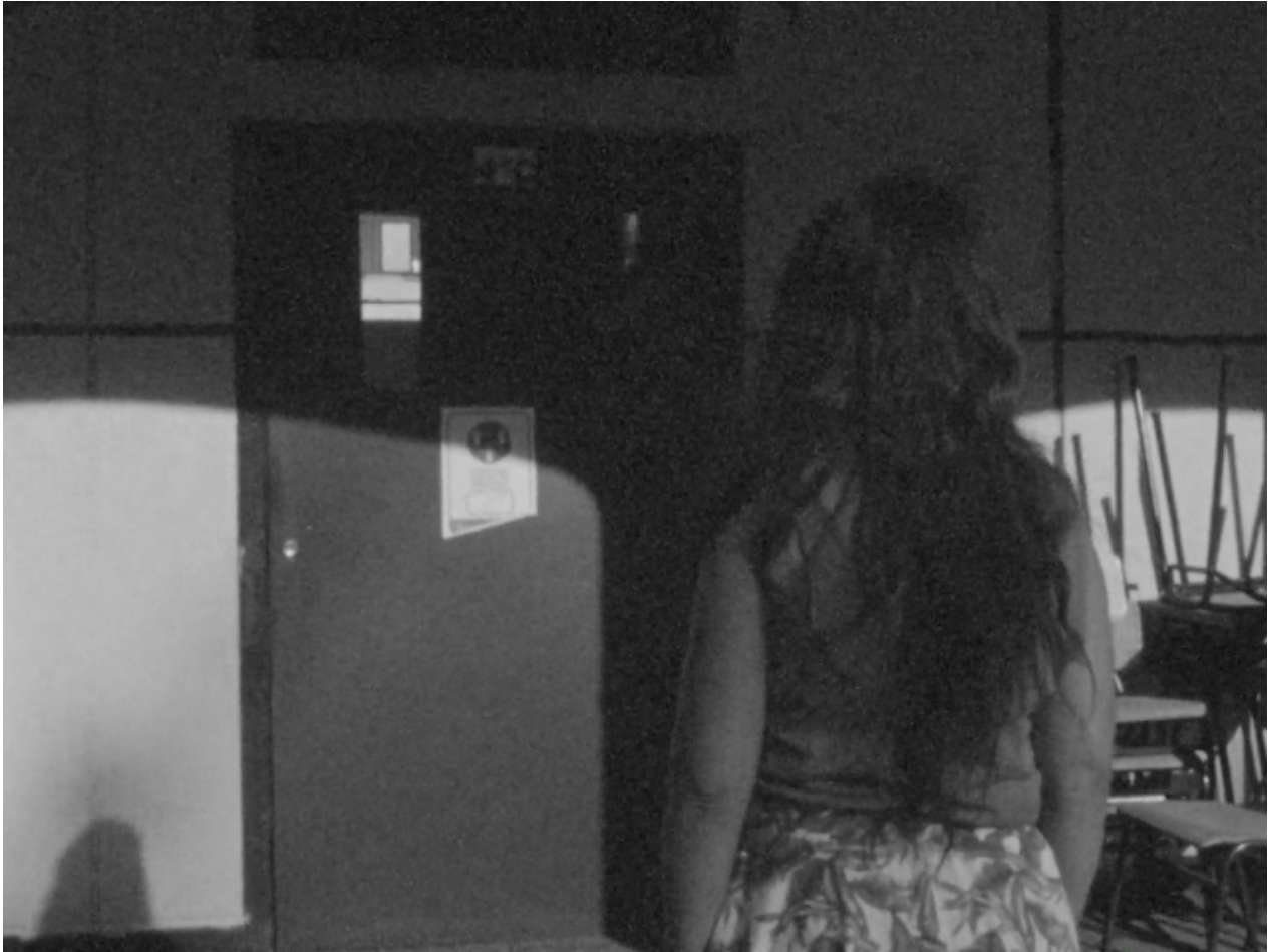
La directora, rememorando la etapa de su Colegio.

una revelación que la invocó a observar los conflictos bélicos y atropellos sobre los derechos humanos de forma universal. Al relacionar la directora distintas coordenadas geográficas, referencias pictóricas, poéticas, del pueblo, ensayos y cinematográficas, la conduce a crear un corpus insoslayable. Espacios del horror, desfigurados, aniquilados y perdidos en un limbo a rescatar y no olvidar. La historia la escriben los vencedores, intentan crear una capa de polvo gruesa y pesada sobre los vencidos. Franco lo hizo, Pinochet también en distintas épocas, pero con igual represión y represalias.