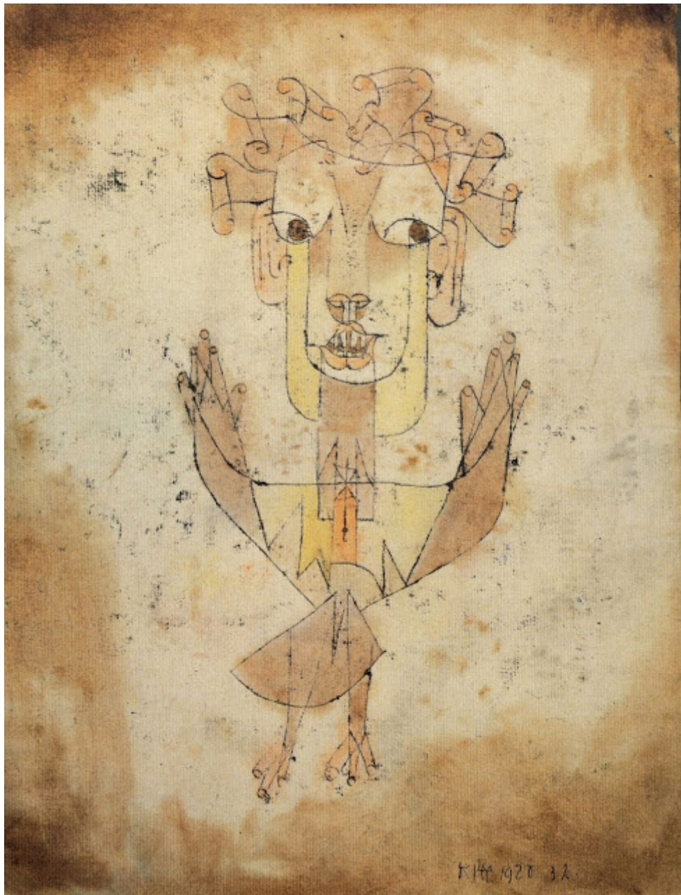
"Angelus novus" (1920). Paul Klee.

En esas zonas y construcciones en ruinas, exterminadas ideológica y materialmente, testigos de la catástrofe; discurso amargo y amenaza de la represión para los que no se exiliaron, pero también, con los años, la voz de los fallecidos que no quieren ser silenciados.