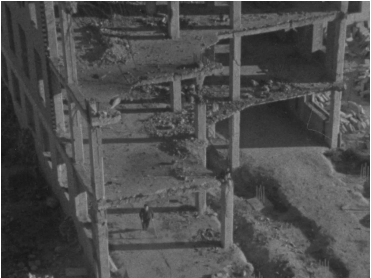
Ciudad Universitaria de Madrid, aniquilada por la Guerra Civil española. Documental "Paseo por una guerra antigua (1948).

Los pensamientos de Benjamin (Bien le gustaría detenerse, despertar a los muertos y recomponer el pasado) y los dolorosos versos de Zambrano ("Muchedumbre") "sobreimpresionados" en el valiente documental de Bardem, Berlanga y Navarro Linares, "Paseo por una guerra antigua" elevan la ya de por sí agria imagen, con ese herido y mutilado de guerra, amputado de pierna, que se pasea con tristeza por la Ciudad Universitaria en 1948; con planos muy ásperos entre esqueletos de edificios devastados, desnudos, arrancados de forma abrupta de su antigua labor, la de formar generaciones libres. Con esos puños cerrados del mutilado que se aferran con rabia e impotencia a su muleta y que no pueden alzarse por temor a la censura y una dictadura en plena efervescencia, pero que son el símbolo de la Resistencia. Pasos lentos del mutilado, con resonancias de disparos como seca banda sonora; pasos del miedo por la huella de la vil contienda; pasos que recorren el drama para no olvidar; pasos con un solo apoyo por la ausencia de tantos compañeros caídos.