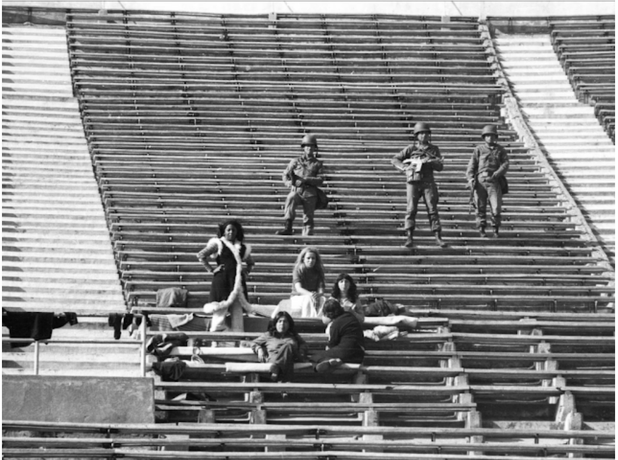
Estadio Nacional, utilizado tras el Golpe de Estado como campo de concentración y torturas.